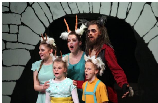
Familie musikalen Ulven – februar 2019

For å kunne gjennomføre den skisserte satsningen beskrevet ovenfor, må kulturskolen tilføres stillingsressurser som muliggjør økt innsats og opptrapping av prosjekter.